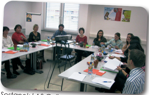
Sestanek LAS Celje, september 2007.