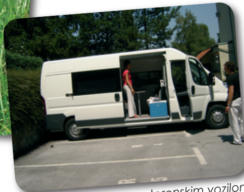
K uporabnikom drog s terenskim vozilom.