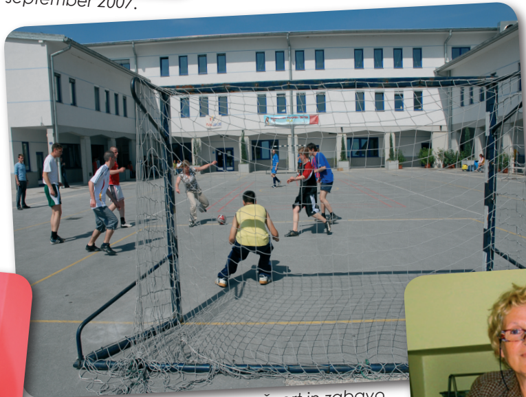
Mladost potrebuje prostor za šport in zabavo.